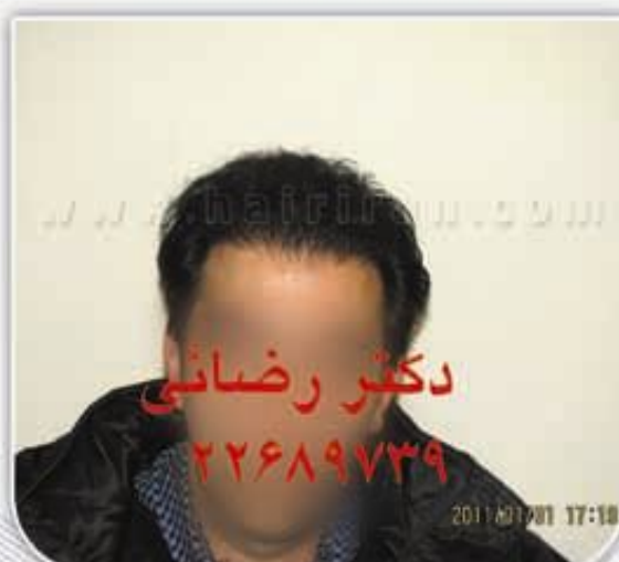
۸ ماه پس از کاشت