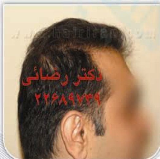
۷ ماه پس از کاشت