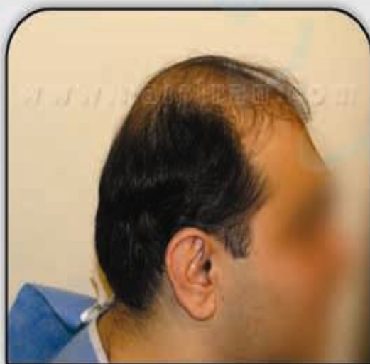
قبل از کاشت