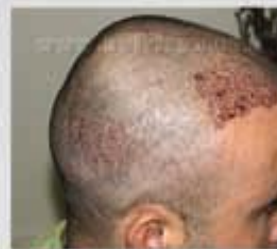
روز عمل ، انهای عمل FIT

روش FIT یک پیشرفت هیجان انگیز در علم کاشت مو می باشد و کاشت مو را به عمل جراحی با عوارض کم تبدیل کرده است. اینکه اسکار و جوشگاه زخم نداریم برای بیمار و جراح بسیار رضایت بخش است و دوران نقاهت پس از عمل کوتاهتر و راحت تر شده است. اما هنوز روش FIT کامل نشده است. نیاز به مهارت بالای جراح دارد و محدودیت های خاصی در برداشت و محل کاشت وجود دارد و مهمترین مسئله این است که روش FIT برای طاسی های زیاد و زمانی که بانک مو محدود می باشد اصلا مناسب نیست و بیشتر زمانی استفاده می شود که طاسی کم و بانک مو قوی می باشد.