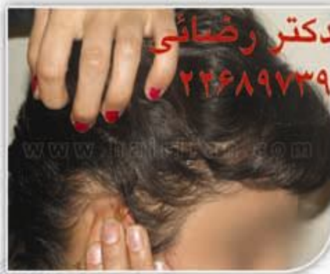
بعد از کاشت