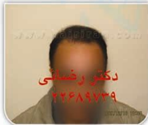
▶ ۶ ماه پس از کاشت (روش FUT)