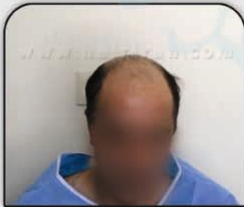
◀ قبل از کاشت (روش FUT)

برداشت مو از بدن نیز انجام می شود برداشت مو از بدن فقط با روش FIT انجام می شود و معمولاً از موهای سینه و پشت برداشته می شود. FIT از بدن در شرایط بسیار محدود انجام می شود و کیفیت و تعداد موهای بدن تفاوت بسیاری با موهای سر دارد. اگر مثلاً در یک کاشت موی ترکیبی حدود ۸ تا ۱۰ هزار تار مو برداشت و کاشت می شود با FIT از بدن حدود ۵۰۰-۱۰۰۰ تار مو برداشت و کاشت می شود. بدلیل این مشکلات معمولاً تا وقتی بانک موی سر در دسترس باشد برداشت از بدن غیر عاقلانه می باشد.