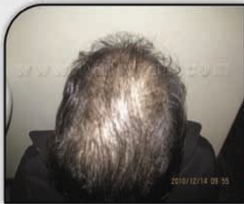
قبل از کاشت

قابل ذکر است که اکثر خانم هایی که ریزش مو دارند کاندید روش PRP می باشند و اکثراً نتیجه مطلوبی از PRP می گیرند. بنابراین درمان جدید ریزش موی خانمها PRP یا کاشت مو + PRP می باشد.