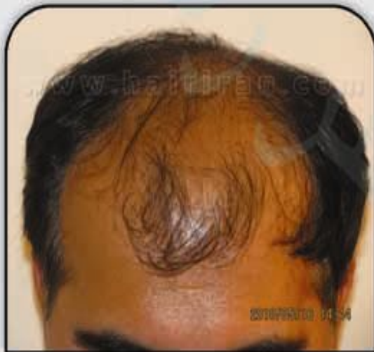
قبل از کاشت

موهای کاشته شده نمای کاملاً طبیعی دارند، زنده هستند، رشد طبیعی دارند و دائمی هستند. می توان آنها را اصلاح و آرایش کرد، کوتاه یا بلند کرد، فرم داد و پس از رشد کامل موها نیاز به هیچ دارویی ندارند و مراقبت خاصی نیز نیاز ندارند. نتیجه نهائی کاشت مو پس از ۶-۱۲ ماه ظاهر می شود و قبل از آن موها کم پشت و نازک دیده می شوند. پیوند مو به فرد طاس و کم مو کمک می کند چهره بهتری داشته باشد، اما ممکن است فرد آنقدر مو نداشته باشد که بتوان تمام سر را پر تراکم کاشت و بخاطر داشته باشید: پیوند مو، قرار دادن موهای خود بیمار با ترتیب و نظم دلخواه ما در مکان دلخواه ما است و زایش و افزایش موی جدید نیست.