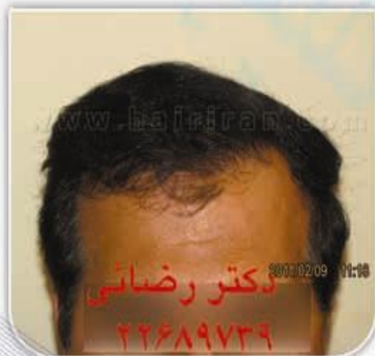
۹ ماه پس از کاشت