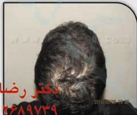
بعد از کاشت