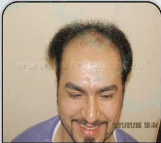
قبل از کاشت