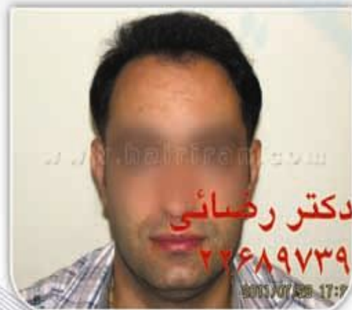
۸ ماه پس از کاشت