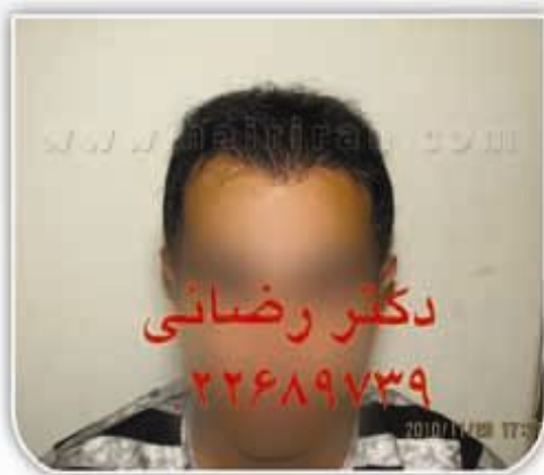
۷ ماه پس از کاشت (روش ترکیبی)