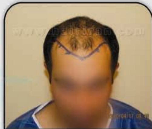
قبل از کاشت (روش ترکیبی)