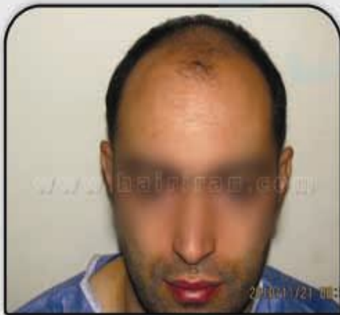
قبل از کاشت