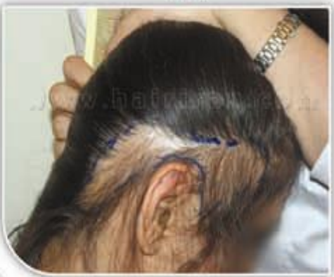
قبل از کاشت