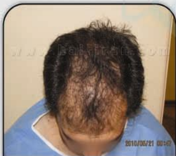
قبل از کاشت